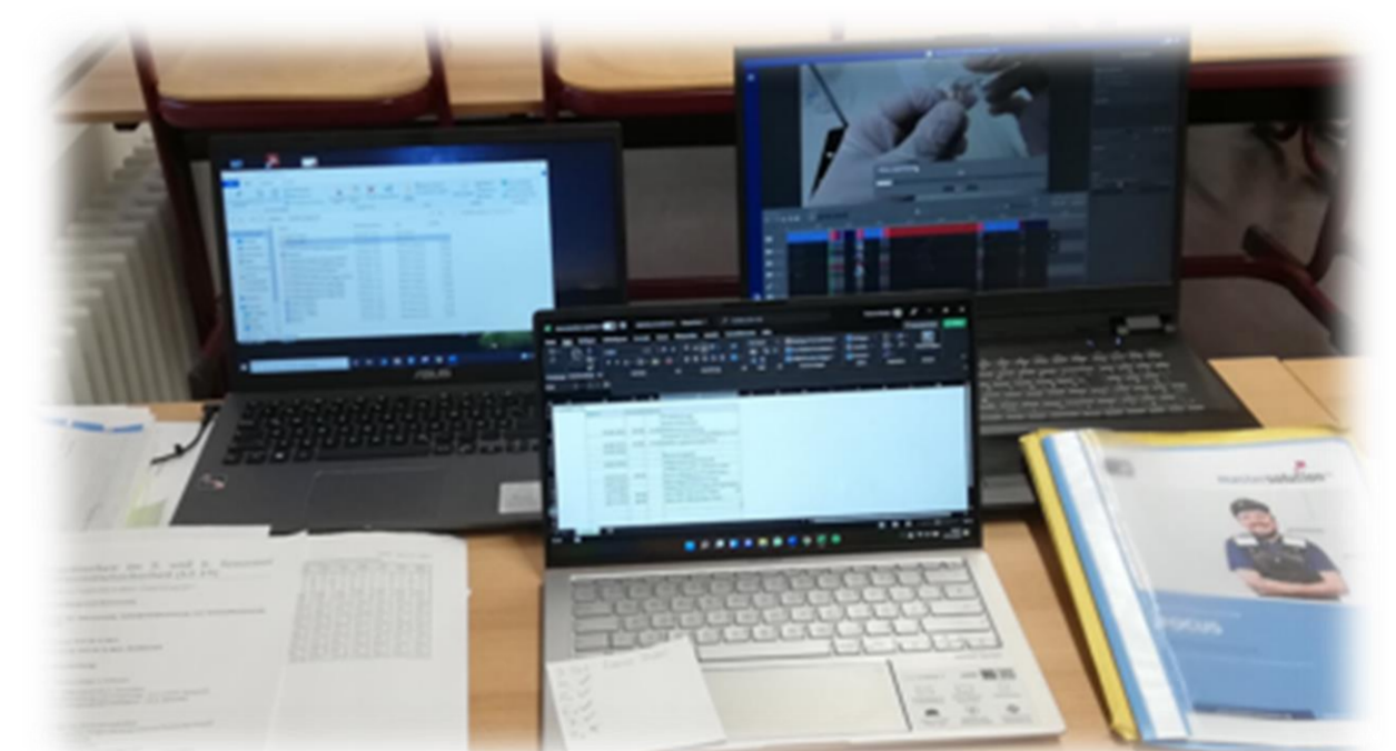
Abb. 4: Videobearbeitung (eig. Aufnahme)