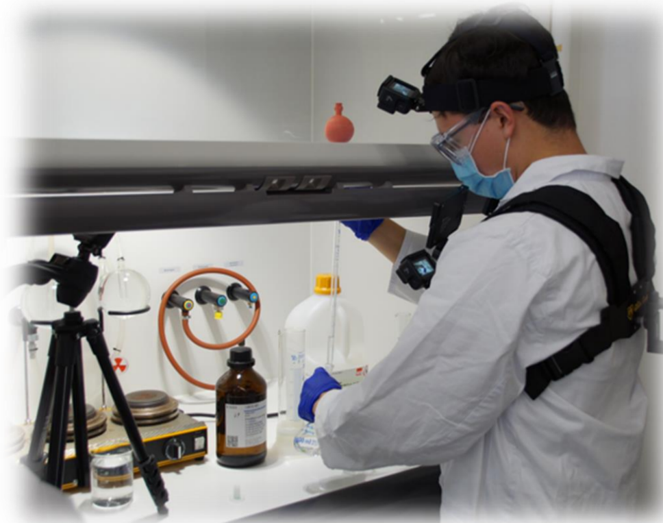
Abb. 3: HP-Bestimmung (Born 2021)